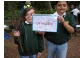
Some children finding brindille, (twigs.)