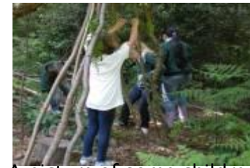
A picture of some children making houses.