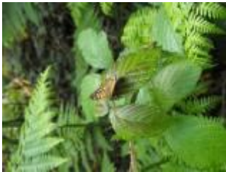
A picture of a papillon (butterfly.)