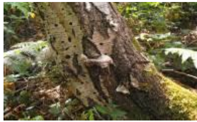
A picture of mycetes (fungi.)