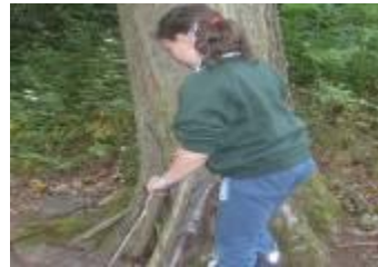
Another house being made.