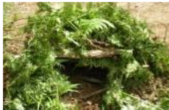
One of the houses.